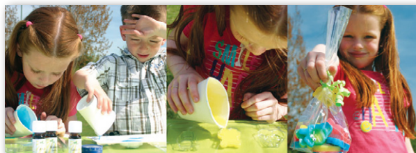
Zeepjes gieten met het Jojoli Actiepakket Soap4Sudan , speciaal gemaakt voor Tork en Oxfam-Novib

Voor het maken van cosmetica met 100% natuurlijke ingrediënten kunt u ook bij ons terecht. Onze startpakketten, losse grondstoffen, cosmeticaverpakkingen en hulpmiddelen bestelt u gemakkelijk via onze website. Voor speciale projecten maken we pakketten op maat, inclusief het specifiek voor uw project ontworpen drukwerk.